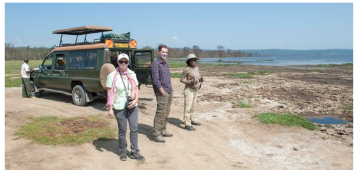
Reisegruppe Juli 2014 am Lake Nakuru