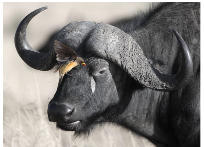
Büffel in der Maasai Mara