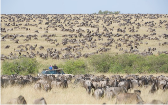
Gnus in der Maasai Mara (zwischen Juli und September)