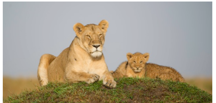
Löwen in der Maasai Mara