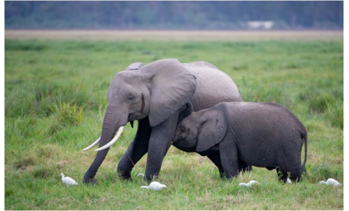
Elefanten im Amboseli Nationalpark